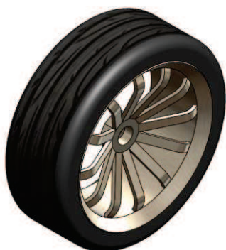
タイヤ&ホイールの モデリング